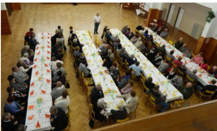
Fotografie ze setkání důchodců dne 13.11.2019

2. ROZ souhlasí s úhradou částky 159.000,-Kč bez DPH firmě PROJEKT IV PLUS, s.r.o. za zpracování projektové dokumentace