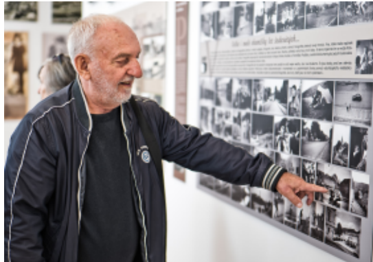
Výstava Svědectví doby v kulturním domě v zasedací síni