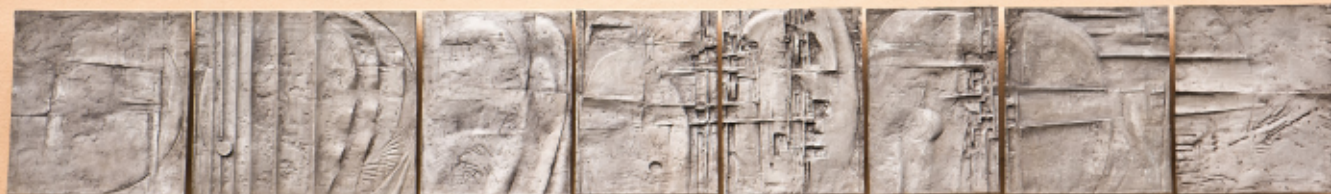
Plastika neznámého autora je od 16.5. 2026 umístěná na stěně restaurace Želivka