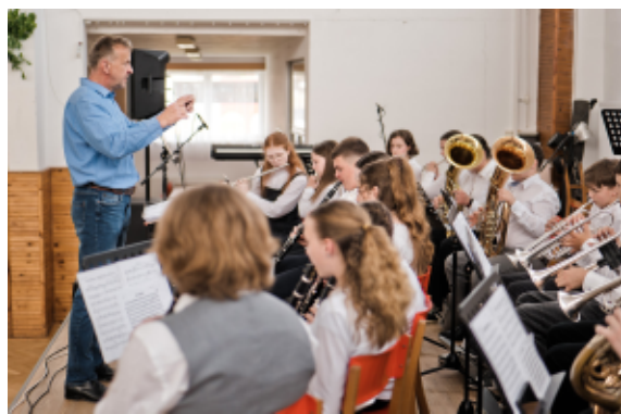
Dechový orchestr LŠU Ledec nad Sázavou