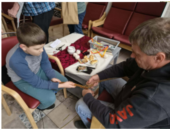
Jarní tvoření v Onšově